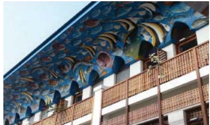
Riwaya ya Tinga Tinga juu ya paa.

Ingawa takwimu za makusanyo ya mwaka 2016/17 hazijatoka, Lakini, kwa mujibu wa TRA, ukusanyaji wa mapato umeshuka kwa kiwango kikubwa. Katika robo ya kwanza ya mwaka huo, TRA hawakukusanya chochote kutokana na kodi ya majengo. hali hiyo haiashirii utendaji duni wa TRA bali kukosekana kwa muda wa kutosha wa matayarisho na kujenga uwezo wa kukusanya kodi hiyo. Pia muda wa makabidhiano ya ukusanyaji wa kodi hiyo kutoka MSM kwenda TRA ulikuwa mfupi sana. TRA wameanzisha kitengo maalum katika Idara ya Kodi za Ndani cha kushughulikia ukusanyaji wa kodi ya majengo (URT 2017, uk. 27, aya 39).