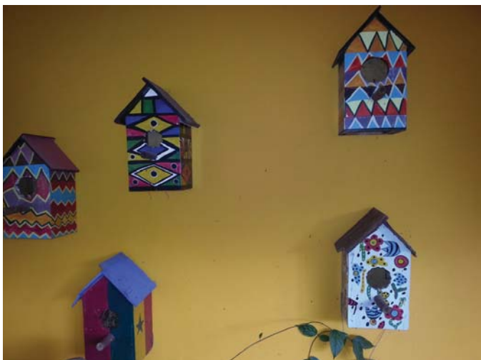
Mali ambazo hazijaingizwa katika Rejista Masaki.

Mwezi Februari 2014, Serikali ilitangaza kurejeshwa kwa mamlaka ya ukusanyaji wa kodi ya majengo kwa Halmashauri za Miji/Majiji mara moja. Uamuzi huu haukudumu kwa muda mrefu. Mwezi Julai, 2016, utozaji wa kodi ya majengo ulirejeshwa tena serikali kuu na TRA ikapewa wajibu kamili wa kusimamia kodi hiyo nchini. Katika andiko hili, kwanza tunatoa historia ya kuhodhi madaraka ya kukusanya kodi ya majengo na kugatua madaraka hayo kwa Mamlaka za Halmashauri za Miji/Majiji. Kisha tunachambua mtiririko wa upatikanaji wa mapato chini ya mamlaka tofauti za usimamizi wa ukusanyaji wa kodi hiyo katika manispaa za jiji la Dar es Salaam. Aidha tunaeleza tofauti zilizopo katika