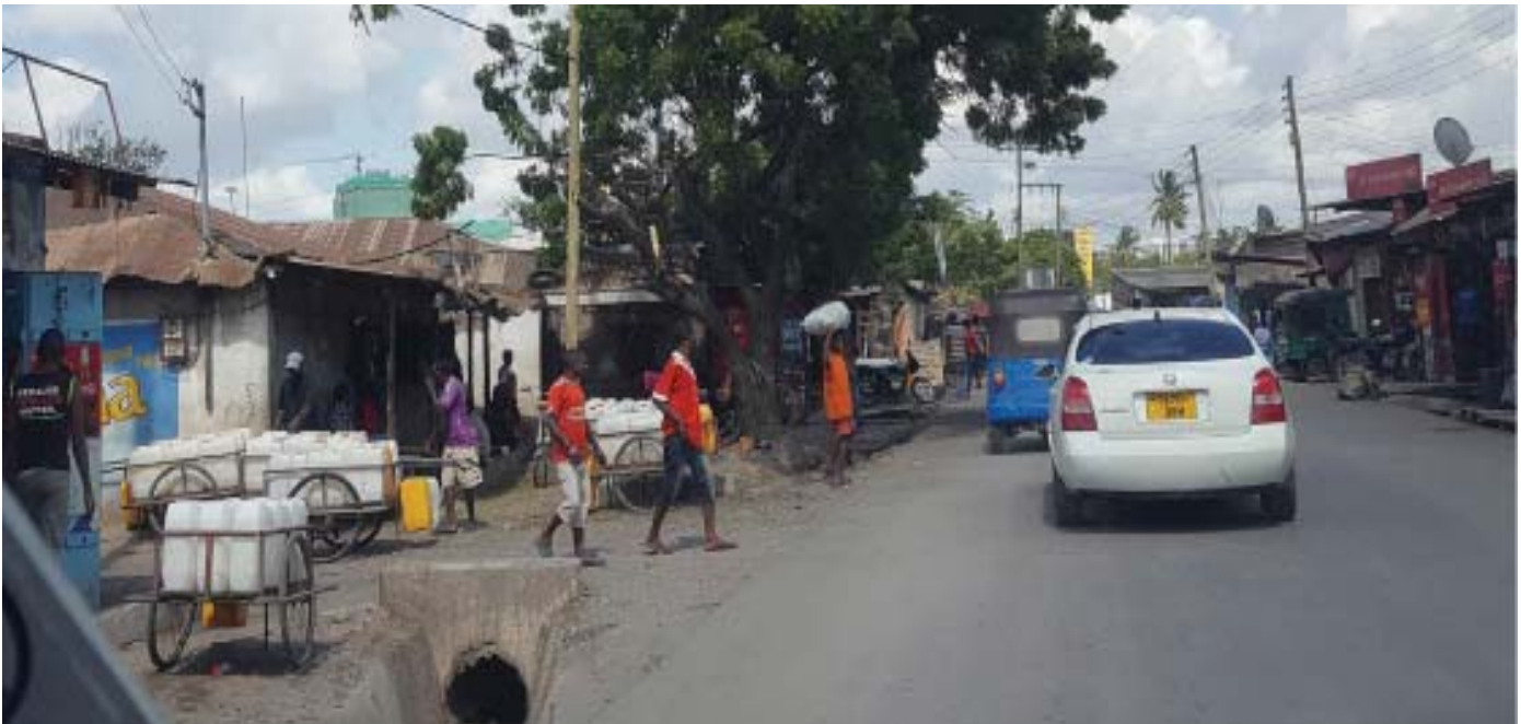
Eneo Jirani na Sinza, Dar es Salaam.